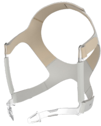
Kopfbänderung JULIA inkl. Bänderungsclips standard: LMT 26856 large: LMT 26949